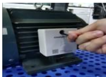
图 7. 智能温振传感器铝卡固定图