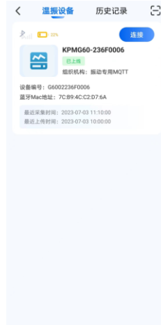
图 12. 温振设备列表和历史记录