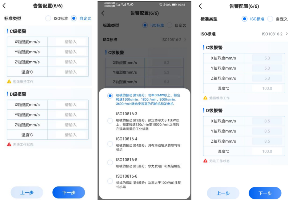
图 19. 向导模式的告警配置界面

第十步：告警配置，用于设置告警的限值，分为 ISO 标准和自定义两种方式。ISO 标准是依据电机的参数与标准匹配，自定义是客户根据自己的经验，给旋转类设备设置的合理告警限值。由于旋转类设备的型号比较多，安装方式不尽相同，采用自定义的方法，需要具备旋转类设备运行的丰富经验。