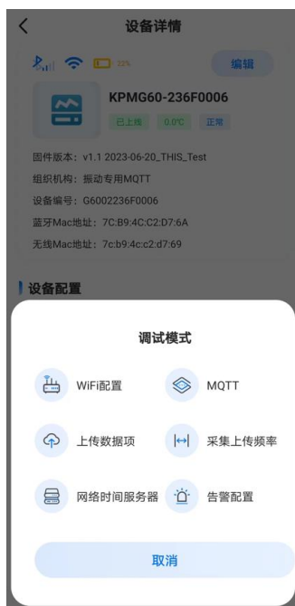
图 20. 调试模式的配置界面