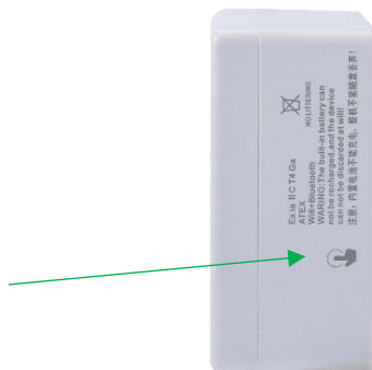
图 5. 智能温振传感器侧面图