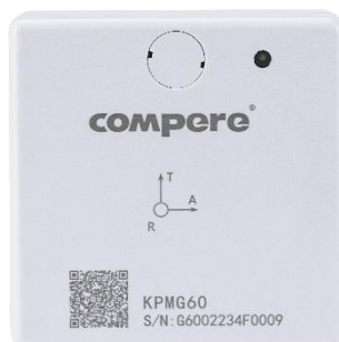
图 21. 温振传感器的坐标方向