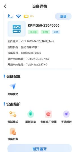
图 13. 温振传感器配置界面

第五步：点击向导模式，进行 WiFi 配置，配置本地的 WiFi 名称，WiFi 连接的密码。（需要注意传感器用的是 2.4G 的 WiFi。）