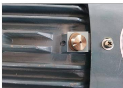
图 8. 平底安装图