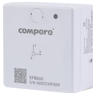
图 4. 智能温振传感器外形图