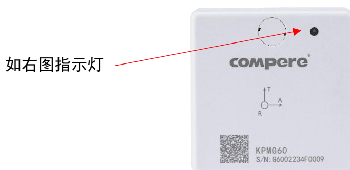
图 5. 智能温振传感器正面图