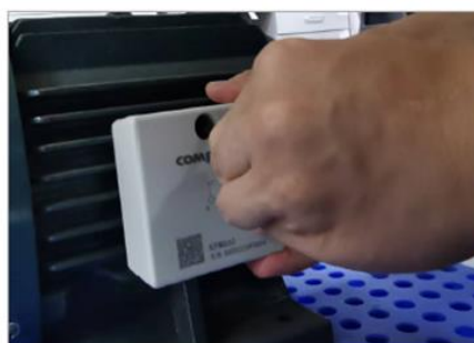
图 9. 智能温振传感器平底固定图