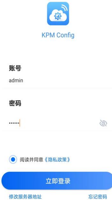
图 10. 配置 APP 登录界面

第二步：双击传感器右侧的触摸键，传感器的指示灯变成橙色快速闪烁的状态，点击温振设备，进入列表。