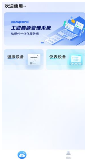
图 11. 配置选择界面

第二步：双击传感器右侧的触摸键，传感器的指示灯变成橙色快速闪烁的状态，点击温振设备，进入列表。