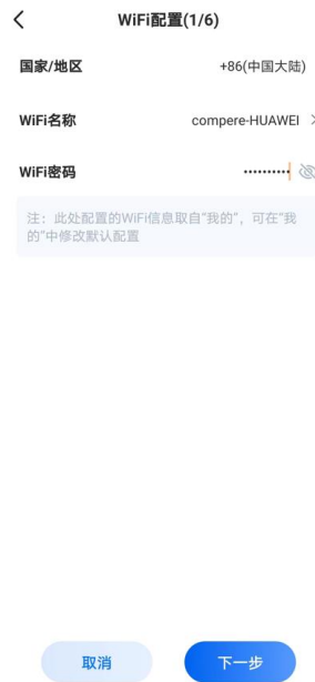
图 14. 向导模式的 WiFi 配置界面

第六步：MQTT 配置，需要配置连接平台的地址和端口号，用户名和密码与平台登录一致，用于 APP 安全登录。客户端 ID 和主题是传感器蓝牙传输的，可以手动修改。（如果传感器传的平台非我公司配套的系统，需要提前开发测试，测试成功后，才可以进行 MQTT 配置。）