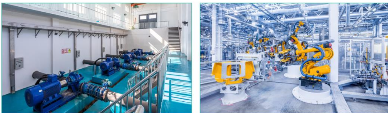
图 3. 设备现场图

告别疲于奔命式的加班抢修，降低企业员工的劳动强度，有效减少人力成本，提高企业智能化、信息化管理水平