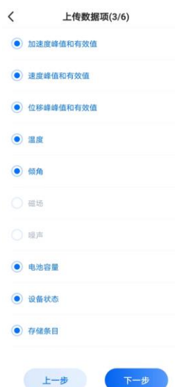
图 16. 向导模式的上传数据项配置界面

第八步：采集上传频率配置，根据客户需要，设置采集和上传的频率。（采集和上传间隔的设置对电池的使用寿命有直接影响，设置的时候需要注意一下。默认测量 5 分钟，发送 24 小时，发送时间太频繁影响设备电池使用时间）