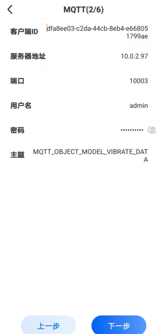
图 15. 向导模式的 MQTT 配置界面

第六步：MQTT 配置，需要配置连接平台的地址和端口号，用户名和密码与平台登录一致，用于 APP 安全登录。客户端 ID 和主题是传感器蓝牙传输的，可以手动修改。（如果传感器传的平台非我公司配套的系统，需要提前开发测试，测试成功后，才可以进行 MQTT 配置。）