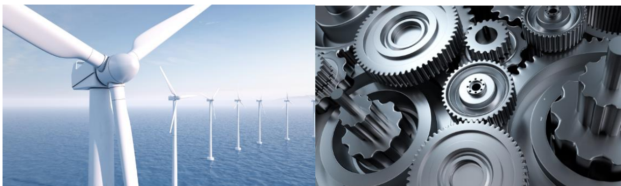
图 2. 应用现场图