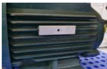
图 6. 铝卡安装图